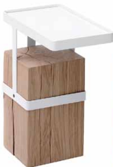
Panca/elemento d'appoggio Raw Object di E15, design Philipp Mainzer. Ridotto a un essenziale parallelepipedo, il legno di quercia spazzolato è lasciato grezzo, con nodi e crepe in evidenza. www.e15.com/selected