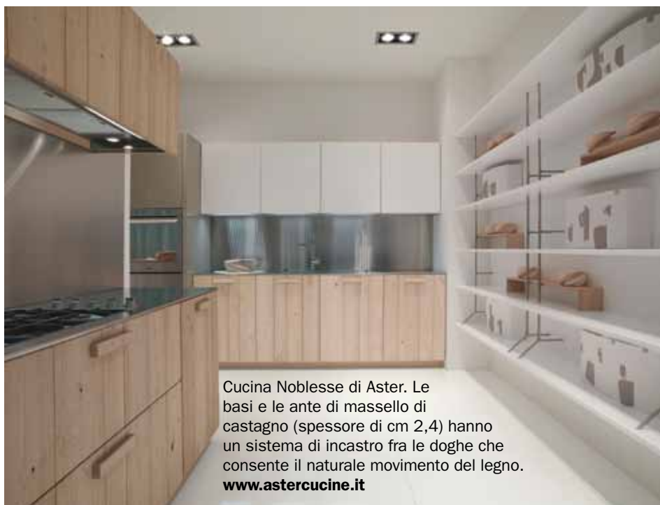
Cucina Noblesse di Aster. Le basi e le ante di massello di castagno (spessore di cm 2,4) hanno un sistema di incastro fra le doghe che consente il naturale movimento del legno. www.astercucine.it