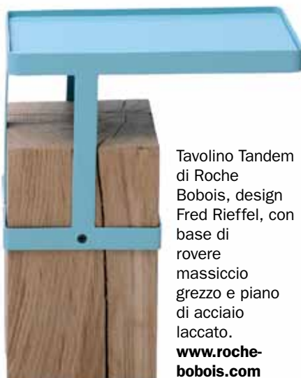
Tavolino Tandem di Roche Bobois, design Fred Rieffel, con base di rovere massiccio grezzo e piano di acciaio laccato. www.roche-bobois.com