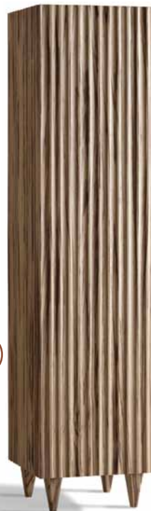
Mobile bifacciale con anta a battente Giano di Morelato, design Ugo La Pietra. Il legno zebrato è lavorato a "onda", mentre la finitura naturale ne mette in evidenza le particolari venature scure. www.morelato.it