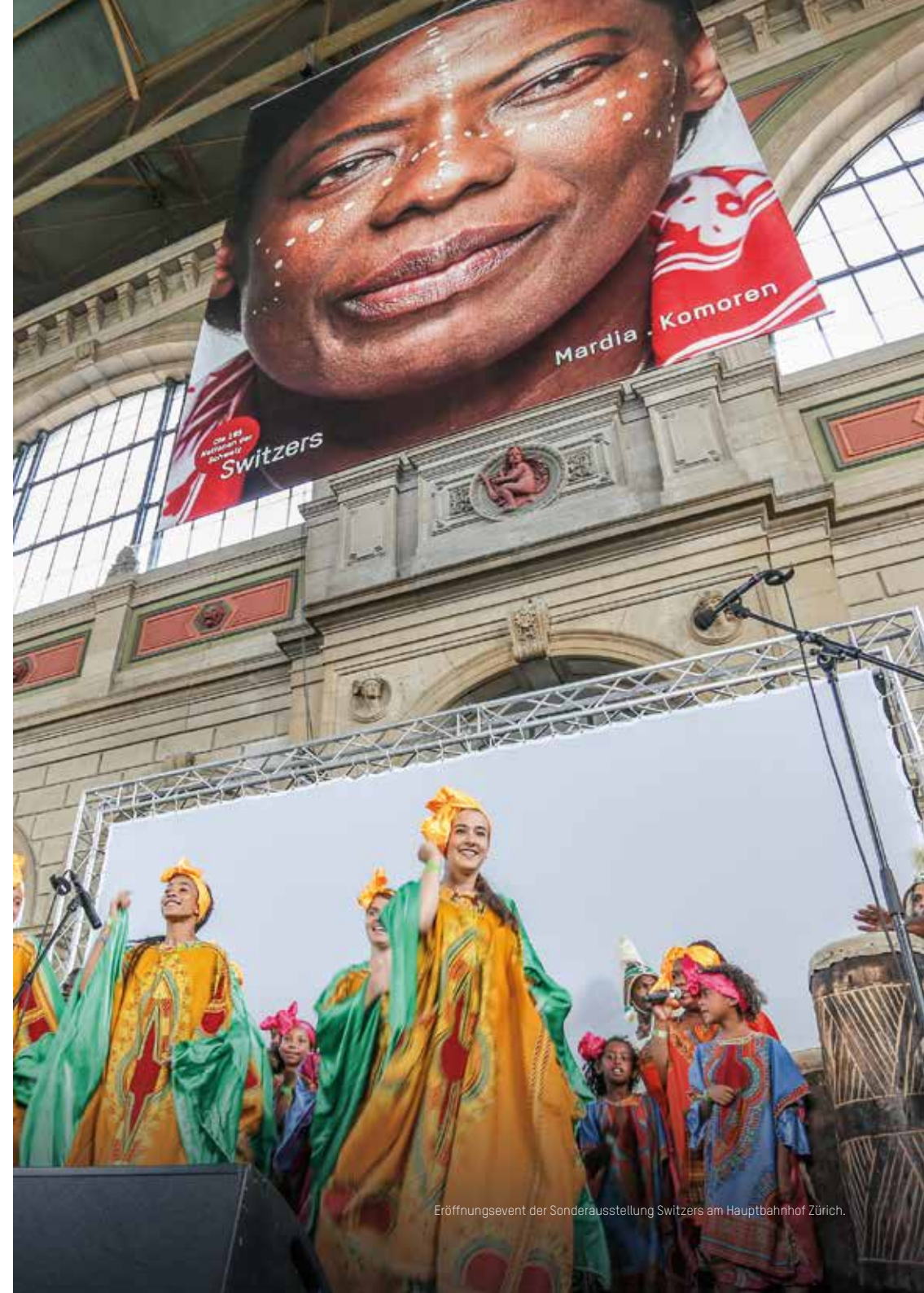
Eröffnungsevent der Sonderausstellung Switzers am Hauptbahnhof Zürich.