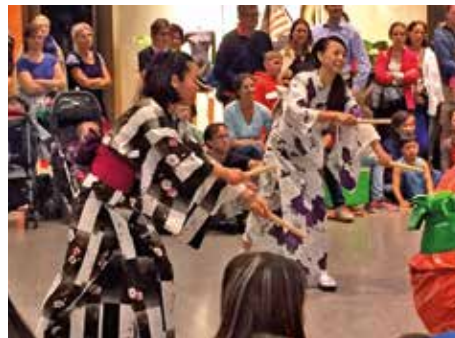
Impressionen des Welt Tanz Festivals, welches am 14. & 15. August 2015 am Hauptbahnhof Zürich und in der Europaallee stattfand.