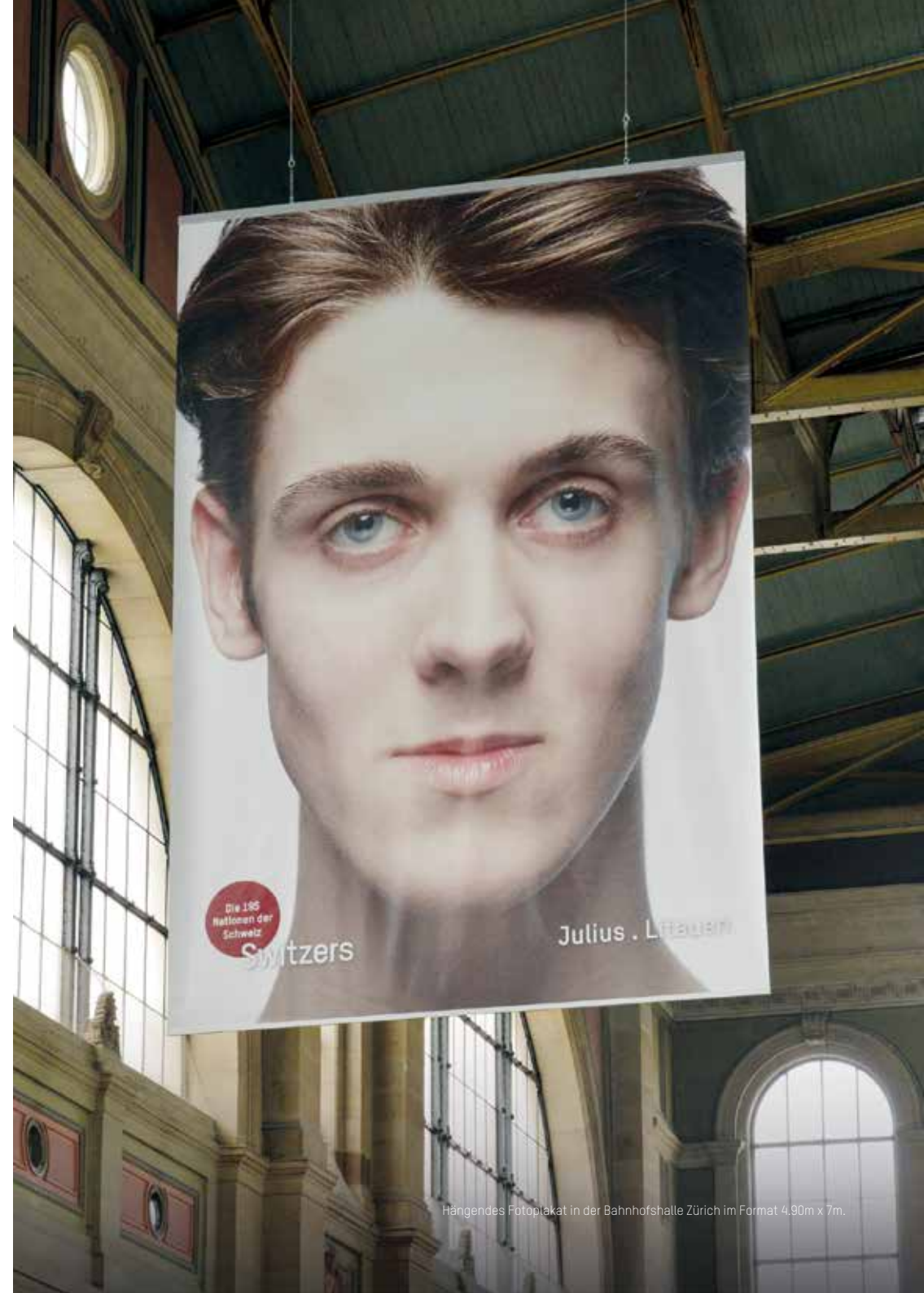
Hängendes Fotoplatat in der Bahnhofshalle Zürich im Format 4,90m x 7m.