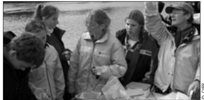
Identification de poissons

les élèves à vérifier certains paramètres biologiques importants pour l'habitat du poisson (vitesse du courant, érosion, couverture végétale aérienne, etc.) par diverses méthodes d'observation sur le terrain adaptées à leur niveau d'enseignement. Par la suite, les jeunes sont invités à réaliser une activité de pêche afin de découvrir ou de mieux connaître les poissons qui occupent l'habitat qu'ils étudient. Enfin, le dernier volet de ce projet prévoit la réalisation d'une action concrète visant à protéger l'habitat du poisson ou à sensibiliser la population.