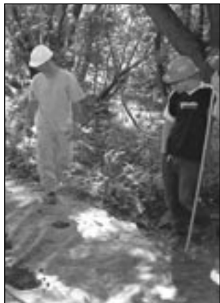
Aménagement du sentier pédestre

Toujours dans le but de permettre l'accès aux merveilles qu'offre le site de la rivière Beauport au plus grand nombre de personnes, le CVRB poursuit l'aménagement d'un sentier pédestre situé au nord de l'autoroute Félix-Leclerc. Réalisé dans le cadre du Chantier urbain de la Ville de Québec, ce projet, qui en est à sa deuxième phase de développement, longe la portion de la rivière qui s'étend de la rue Clemenceau à la rue Saint-Joseph. Sillonnant les berges de ce lieu enchanteur, le sentier révèle des richesses jusqu'à ce jour encore ignorées. Le sentier offrira aux visiteurs un jardin d'oiseaux, un sentier de 2,5 km, des panneaux d'interprétation et la possibilité de contempler toutes les beautés d'une faune et d'une flore dissimulées en plein cœur de la ville.