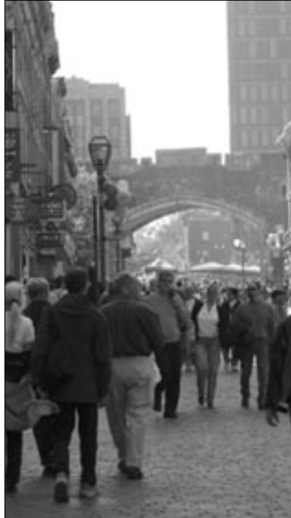
Rue Saint-Jean lors de la journée

La population pouvait enfin respirer et se balader au milieu de la rue! Les enfants ont dessiné sur les pavés pendant que les autres participants ont pu essayer des vélos électriques, assister au spectacle de Polémil Bazar, voir des démonstrations de monocycles et des expositions de véhicules alternatifs pour ne nommer que cela. L'ambiance était à la fête, un mercredi de surcroît!