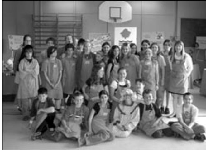
École L'Arc-en-Ciel de Saint-François-Xavier-de-Brompton, le 20 mai 2004.