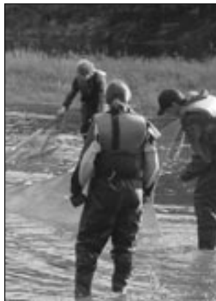
Pêche à la senne