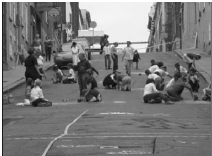
La rue aux enfants

Ce type de journée permet à la population de se réapproprier la rue et de voir comment serait la vie urbaine s'il y avait moins de place consacrée à l'automobile. De plus, cette journée permet d'essayer de nouveaux modes de transport moins polluants, de se sensibiliser aux changements climatiques, de mieux respirer et d'être les acteurs d'un changement de mentalité.