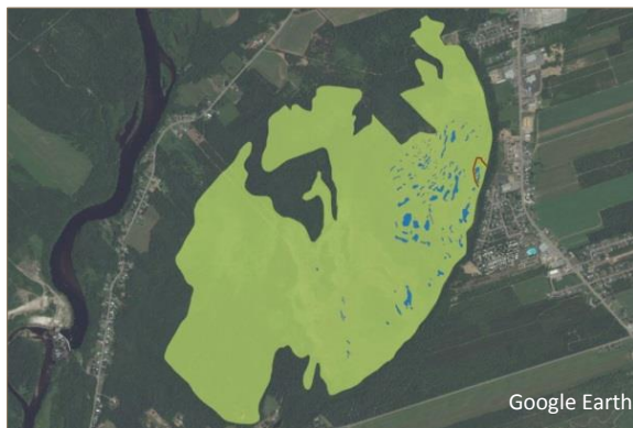
Droséra à feuilles rondes