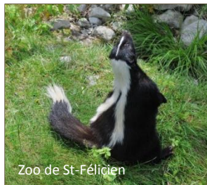
Zoo de St-Félicien