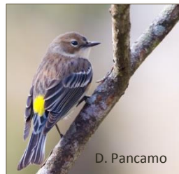
Paruline à croupion jaune

La présence de végétaux en bordure du lac contribue à l'amélioration de la santé du plan d'eau. En agissant comme filtre, les bandes riveraines aident à rafraîchir l'eau, un élément important dans la lutte aux algues bleu-vert.