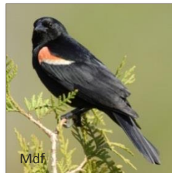
Carouge à épaulettes