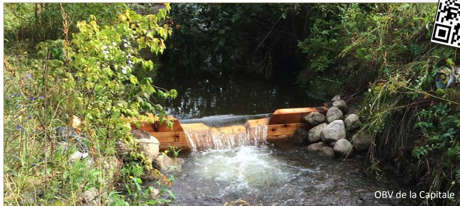
OBV de la Capitale

Située en aval du lac des Roches, la rivière des Roches s'étend sur 8 km sur le territoire des arrondissements de Beauport et Charlesbourg. La rivière des Roches, l'un de principaux tributaires de la rivière du Berger, est considéré comme une véritable pouponnière à poissons et abrite une grande diversité faunique et floristique. La rivière des Roches est l'un des habitats particulièrement importants pour la reproduction de l'Omble de fontaine dans la région de la Capitale-Nationale. En plus d'abriter une pouponnière à poissons, l'alternance d'habitats humides à proximité du cours d'eau favorise la diversification d'espèces fauniques typiques des boisés humides. Dans ces boisés, il est possible d'y apercevoir plusieurs espèces d'amphibiens, dont la grenouille des bois et la rainette crucifère.