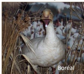
Oie des neiges

Le passage répété des véhicules tout-terrain sur les milieux sensibles compacte les sols qui limite certaines plantes de repousser. Le bruit émis par ces véhicules peut aussi perturber le comportement des oiseaux.