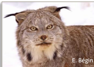
Lynx du Canada