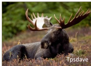
Orignal du Canada

Une partie de la forêt Montmorency, équivalente à 13 % du territoire de la forêt d'enseignement, compte parmi le réseau officiel des aires protégées du Québec.