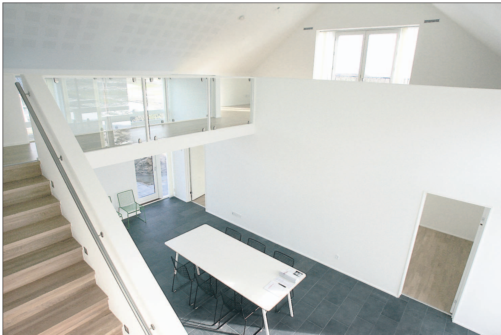
OneRoom er en åben bolig, hvor der er en flydende sammenhæng ikke blot mellem husets rum, men også mellem de to etager.