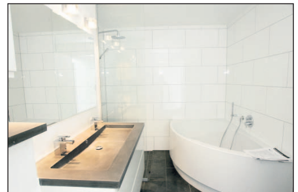
Et enkelt og stilrent badeværelse.