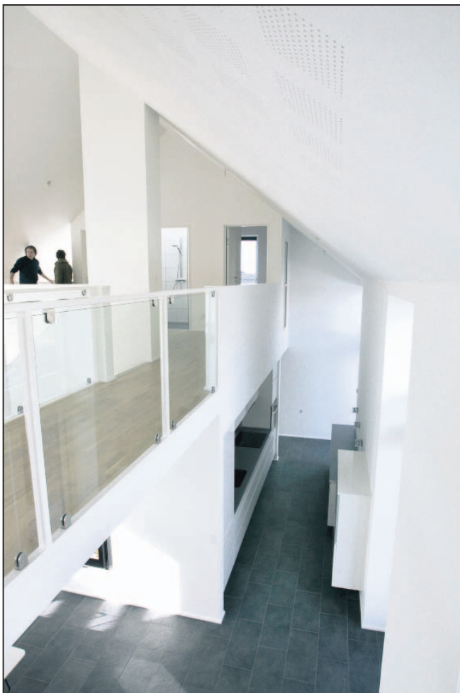
Rummelighed kendetegner boligen, der byder på mange smukke kig fra forskellige vinkler.