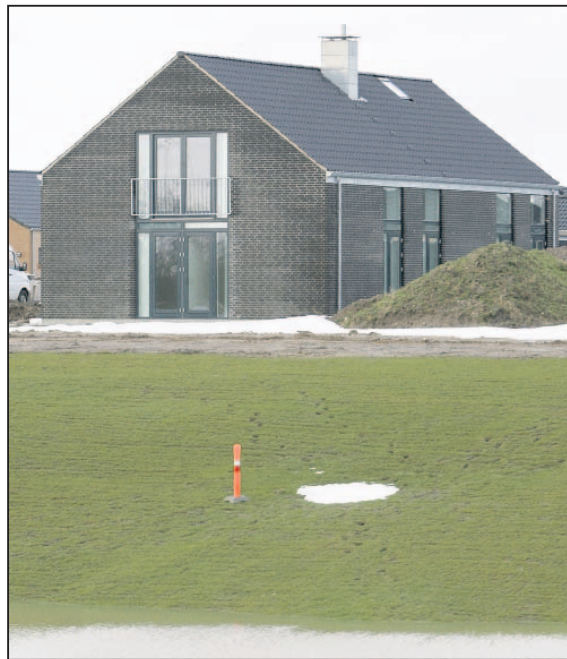
Arkitekt Bjarne Frost betegner huset set udefra som klassisk - »en form for urtypehus - en slags længehus«. Som det ses er beklædningen tegl, men man kunne også vælge træ.