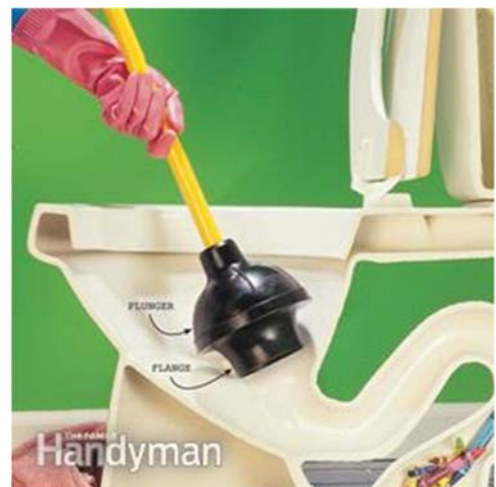
Figure 8 : Utilisation du débouchoir à ventouse pour toilette