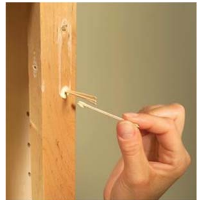
Figure 7 : Réparer un trou de vis endommagé à l'aide de colle et de cure-dents

Voici une vidéo utile sur la marche à suivre pour réparer les portes et les charnières de placards : https://www.youtube.com/watch?v=i_I0tGwI6wk