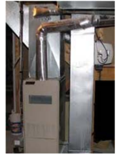
Figure 5 : Générateur d'air pulsé