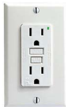
Figure 3 : Prise DDFT

Si un appareil cesse de fonctionner, vérifiez que les appareils et les rallonges sont débranchés, puis réinitialisez le DDFT.