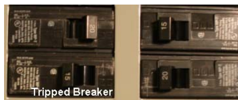
Figure 4 : Déclenchement du disjoncteur

Pour ce faire, localisez votre panneau électrique et ouvrez-le. Regardez si un disjoncteur est passé de la position « on » à la position « off » (déclenchement du disjoncteur), ou s'il se trouve à mi-chemin entre les deux positions.