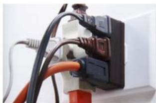
Figure 1 : Circuit surchargé

Quand un circuit est surchargé, le disjoncteur se déclenche. Cette situation se produit quand plusieurs appareils (téléphones, ordinateurs portatifs, systèmes de jeu vidéo, télévision, cafetières, séchoir à