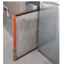
Figure 6 : Filtre de la chaudière