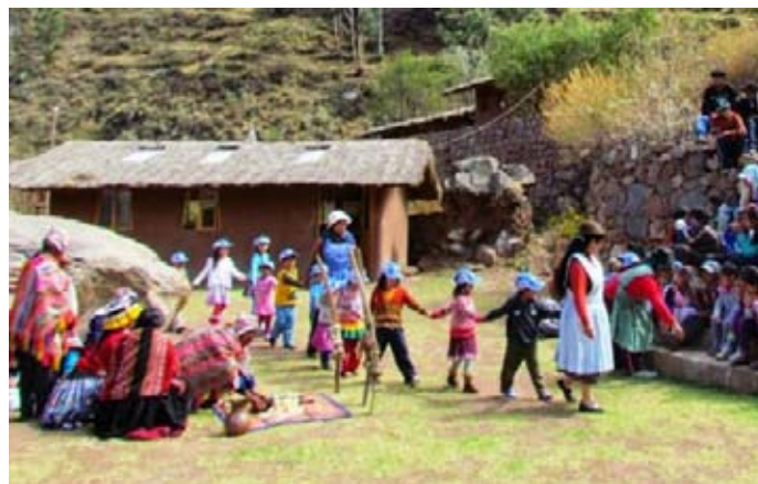
Colegio Waldorf Kusi Kawsay, Valle Sagrado de los Incas

Por consiguiente, la escuela reavivó el ciclo ancestral de celebraciones, orientado al calendario solar y al ritmo de las estaciones agrícolas con el objetivo de