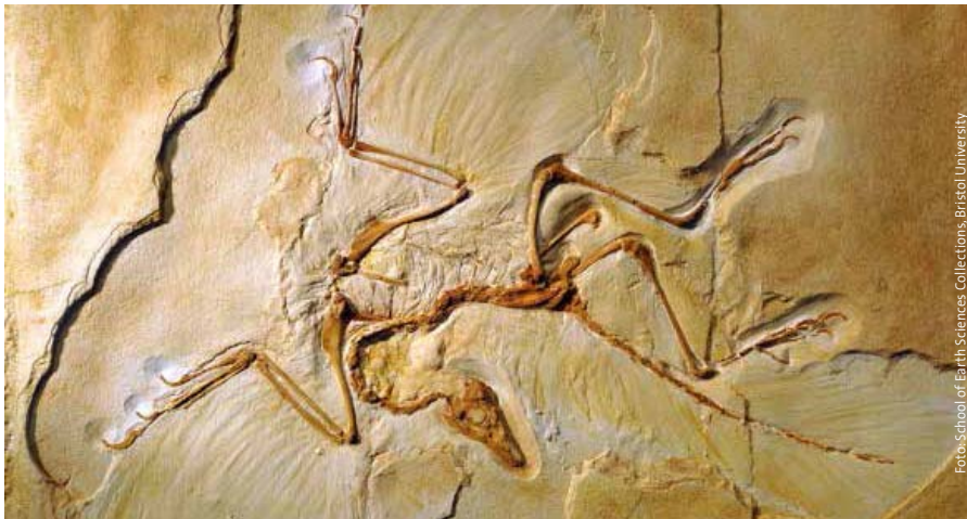
La identidad única de un organismo: el Archaeopteryx

Del 17 al 19 de mayo se celebró un coloquio en el Centro Ruskin Mill Field para estudiar la evolución biológica. El grupo estaba formado por siete representantes de la filosofía, la práctica meditativa, la medicina, la investigación hidrodinámica, la radiestesia, la pedagogía y la biología evolutiva; todos ellos con experiencia en el método Goetheano.