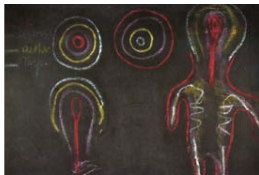
Curso de pedagogía especial, pizarra 7, quinta conferencia

de la conciencia del mundo a la autoconciencia), ningún proceso de desarrollo puede en realidad ser entendido ni tener un transcurso armonioso. Todo desarrollo tiene lugar en la zona de transición, en el cruce, y en el movimiento pendular entre dos polos opuestos. [...]