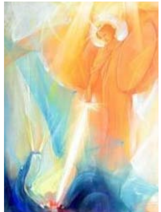
Arild Rosenkrantz: Micael

– La Conferencia de la Escuela Superior, «El ser humano - lugar de la iniciación»,