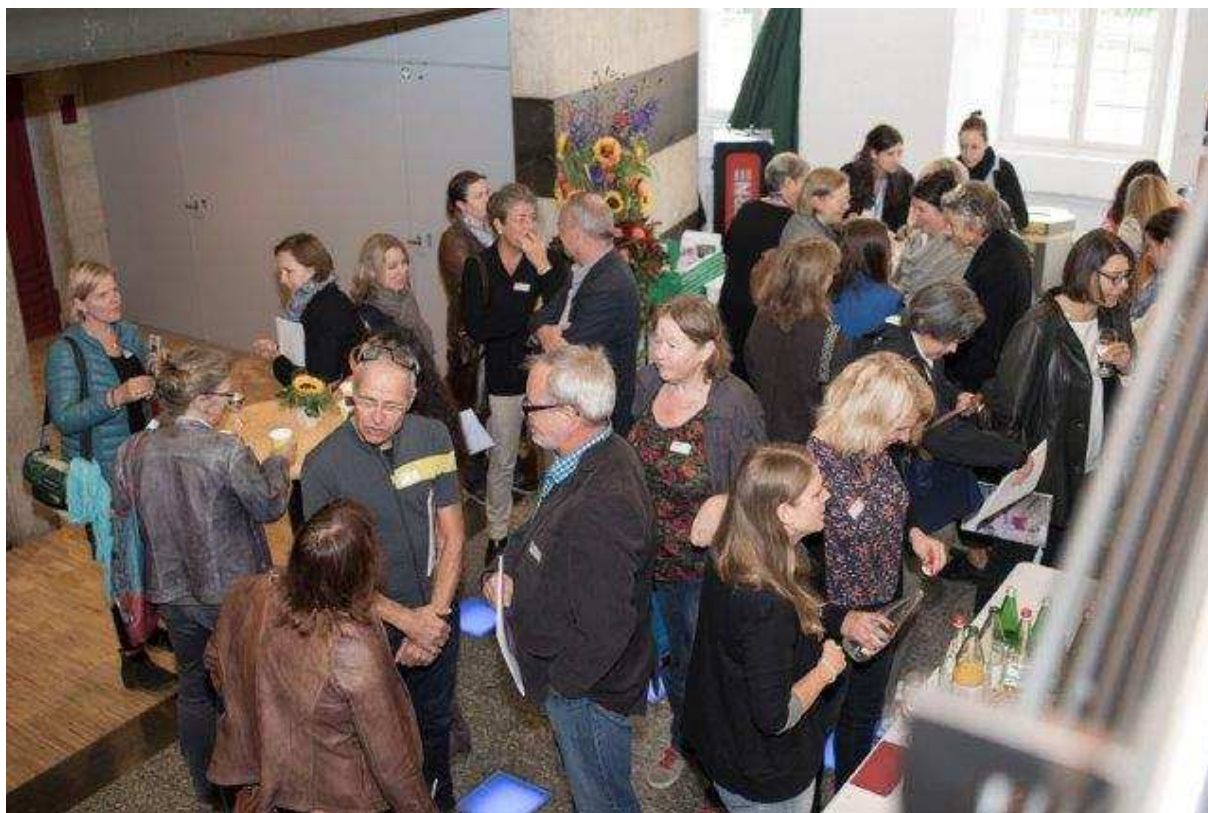
Impressionen aus dem Foyer

Für uns war es eine Herausforderung, Teil der Organisation zu sein und gleichzeitig auch für Inhalte zu sorgen. Das Engagement hat sich gelohnt: Rund 180 Teilnehmende aus dem Bildungsbereich, Vertreter von Sonderschulheimen, Schulpflegemitglieder, Schulpsychologischen Diensten, Vertreter von Kindes- und Erwachsenenschutzbehörden und Asylorganisationen diskutierten den Umgang mit minderjährigen Flüchtlingen und tauschten Erfahrungen aus. Wir von der Krisenintervention Schweiz leisten unseren Beitrag mit den Erfahrungen aus der Notfallpsychologie und der Traumapädagogik. Damit können in der anspruchsvollen Begleitung von geflüchteten Jugendlichen (UMA) auf erprobte Modelle zurückgegriffen werden.