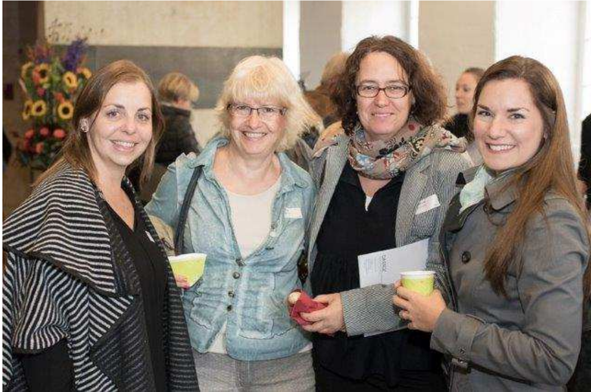
Die Tagung hat sichtlich Spass gemacht!