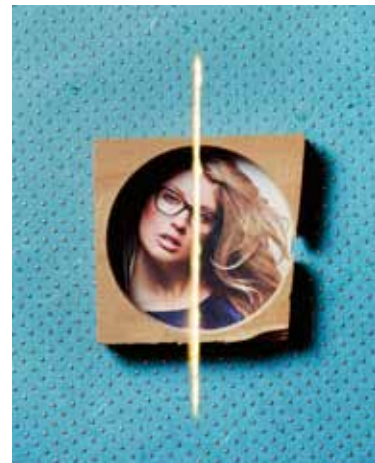
Cohen's Fashion Optical, 2012