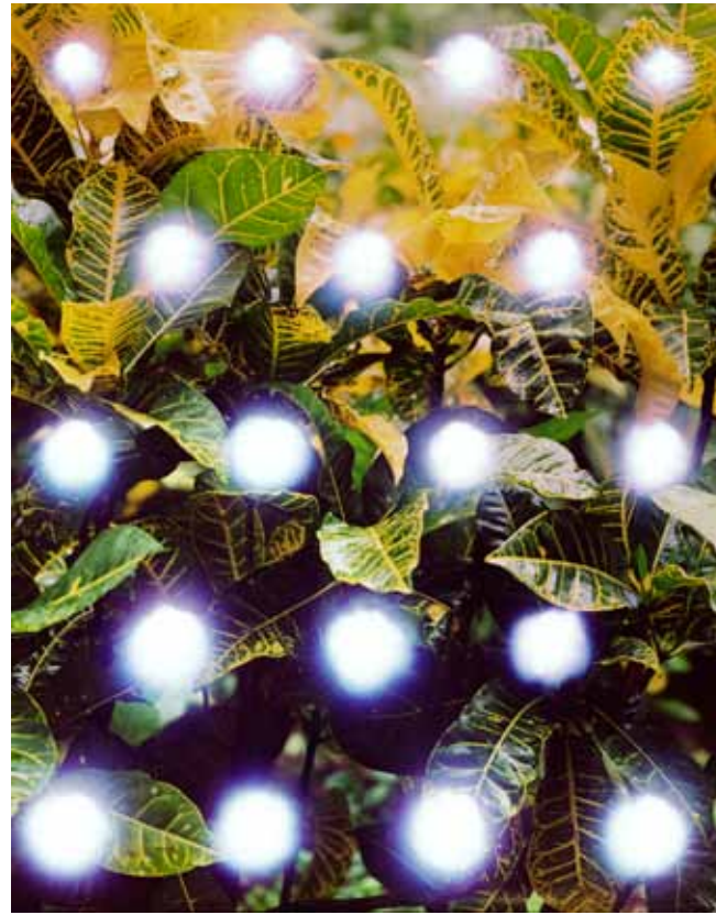
36 Antipopes, 2013