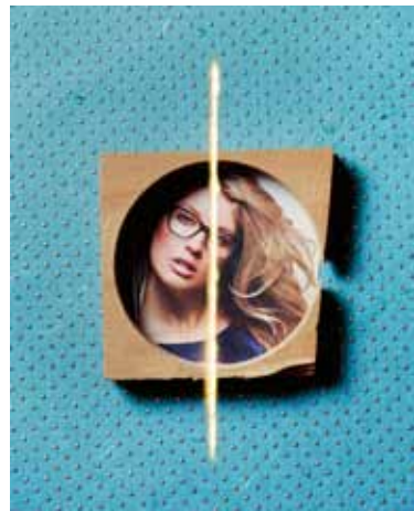
Cohen's Fashion Optical, 2012