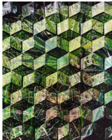
Jean Lafitte 1, 2013