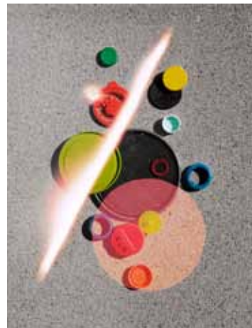
Limonene 26, 2013