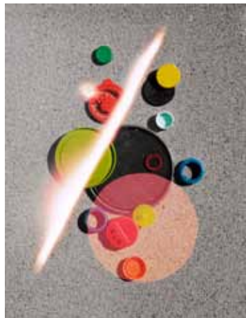
Limonene 26, 2013