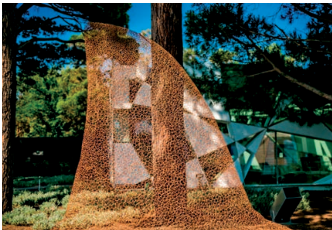
臨風，任哲 蝶恋花，郑路