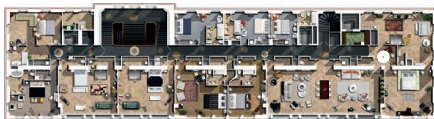
四层 积834平方米 * 主套房