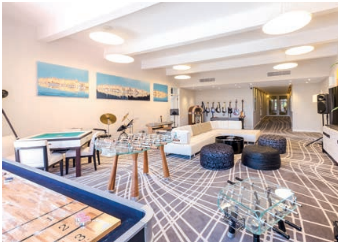
儿童游乐室，游戏娱乐厅卡拉OK