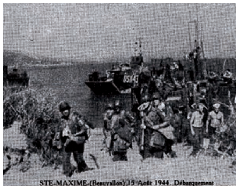
1944年盟军部队在博瓦隆海滩登陆