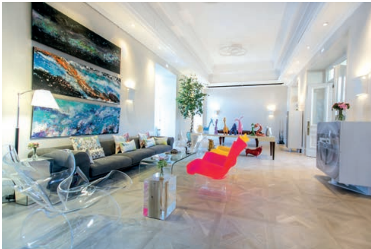
左边：私人餐厅 上面：家庭活动室