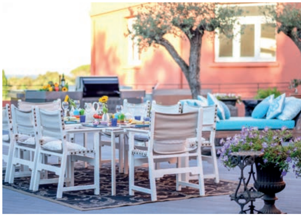
北方室外花园和露天烧烤厨房