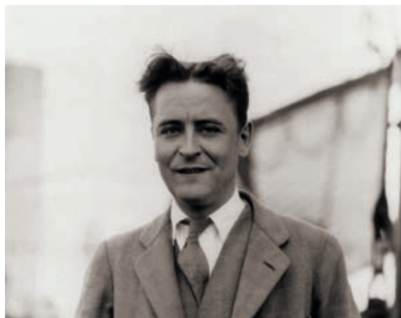
美国作家斯科特·菲茨杰拉德 (F. Scott Fitzgerald) 与其他众多的艺术家一样曾是博瓦隆的常客