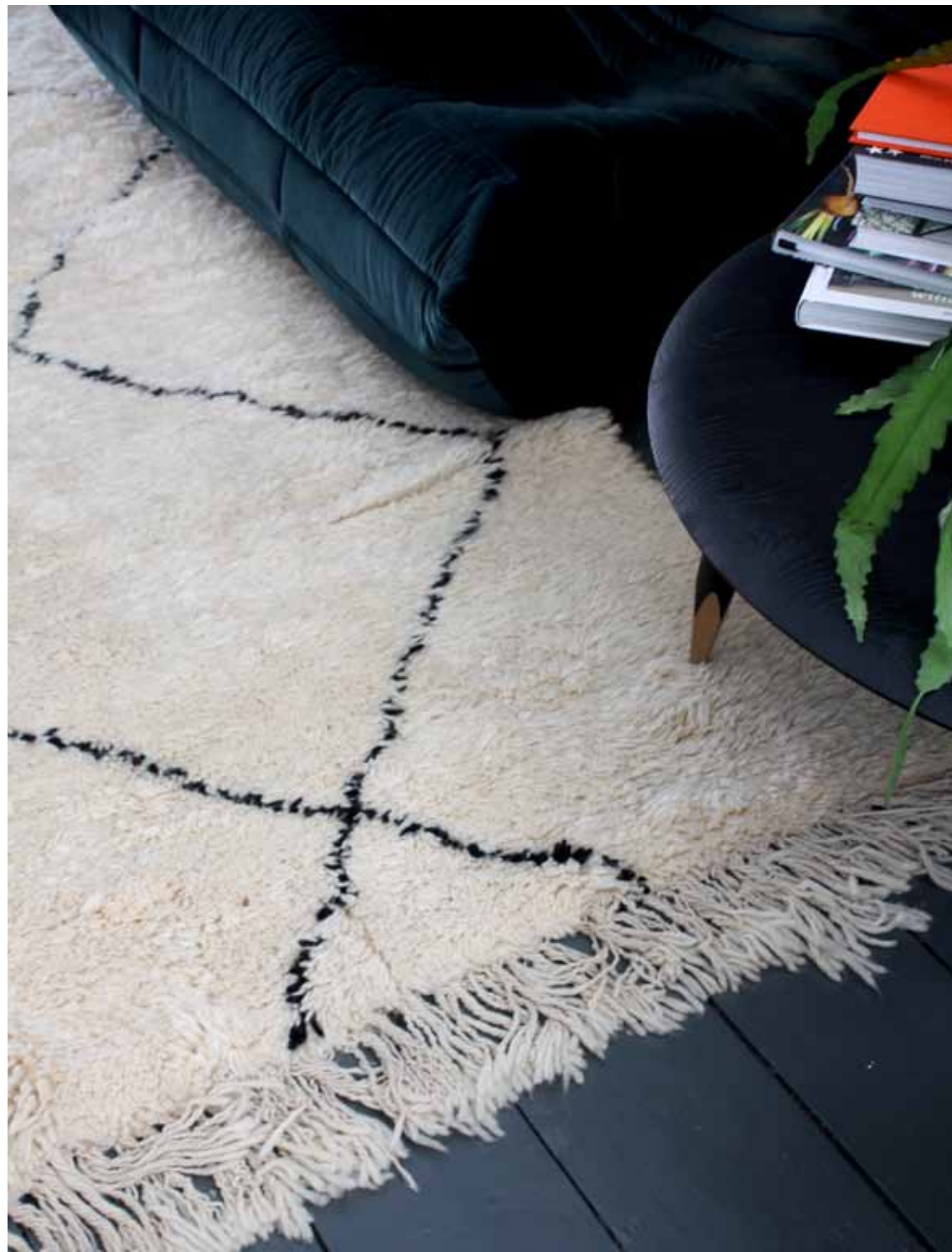
Berbertapijt bij mij thuis