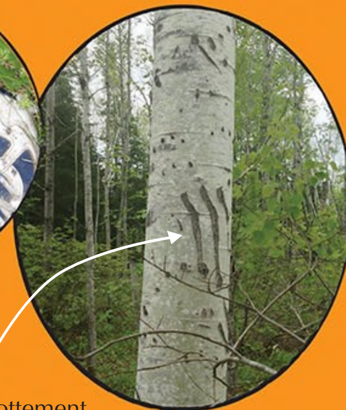
Signes de frottement contre un arbre