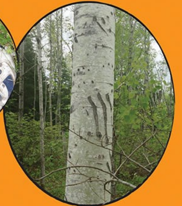
나무에 곰이 남긴 흔적