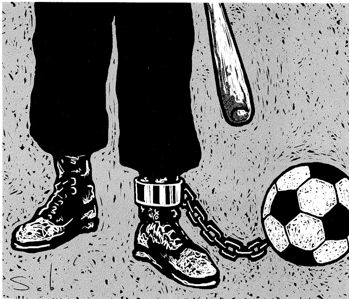
Illustratie Sebe Emmelot