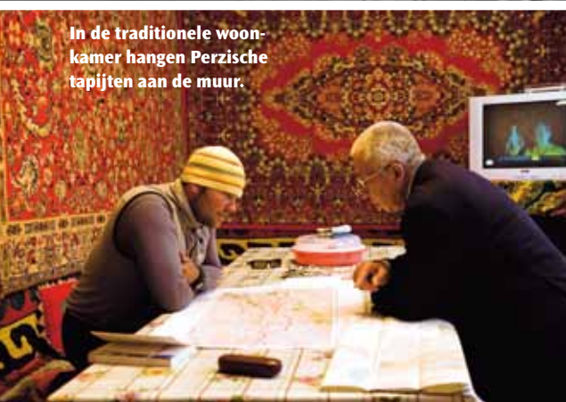
In de traditionele woonkamer hangen Perzische tapijten aan de muur.