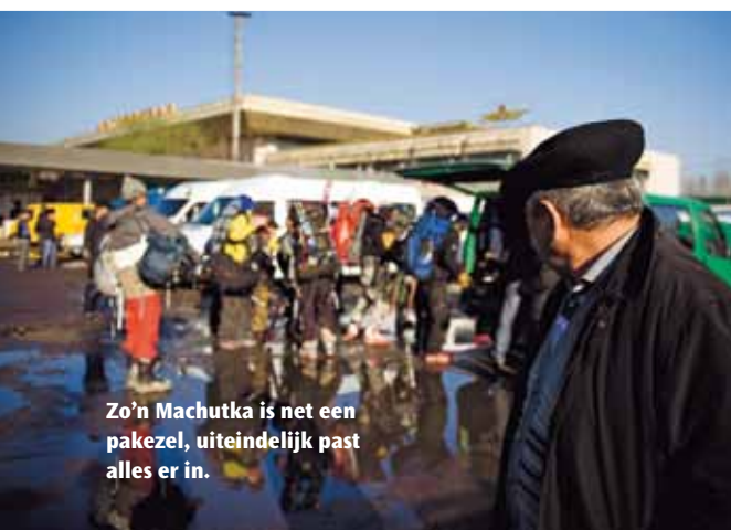
Zo'n Machutka is net een pakezel, uiteindelijk past alles er in.