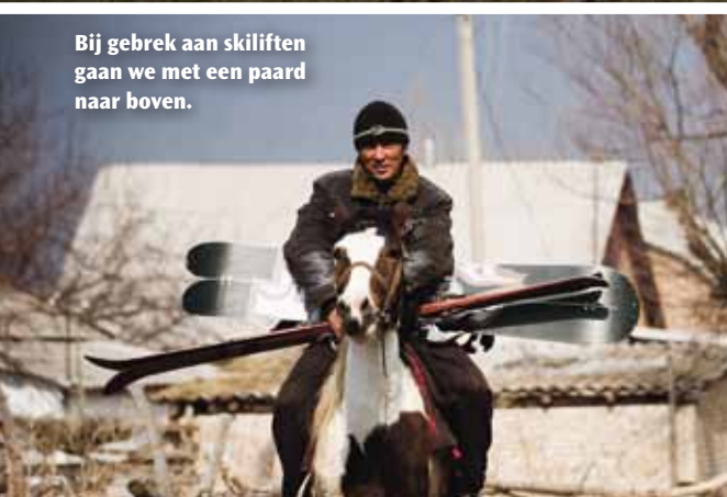
Bij gebrek aan skiliften gaan we met een paard naar boven.