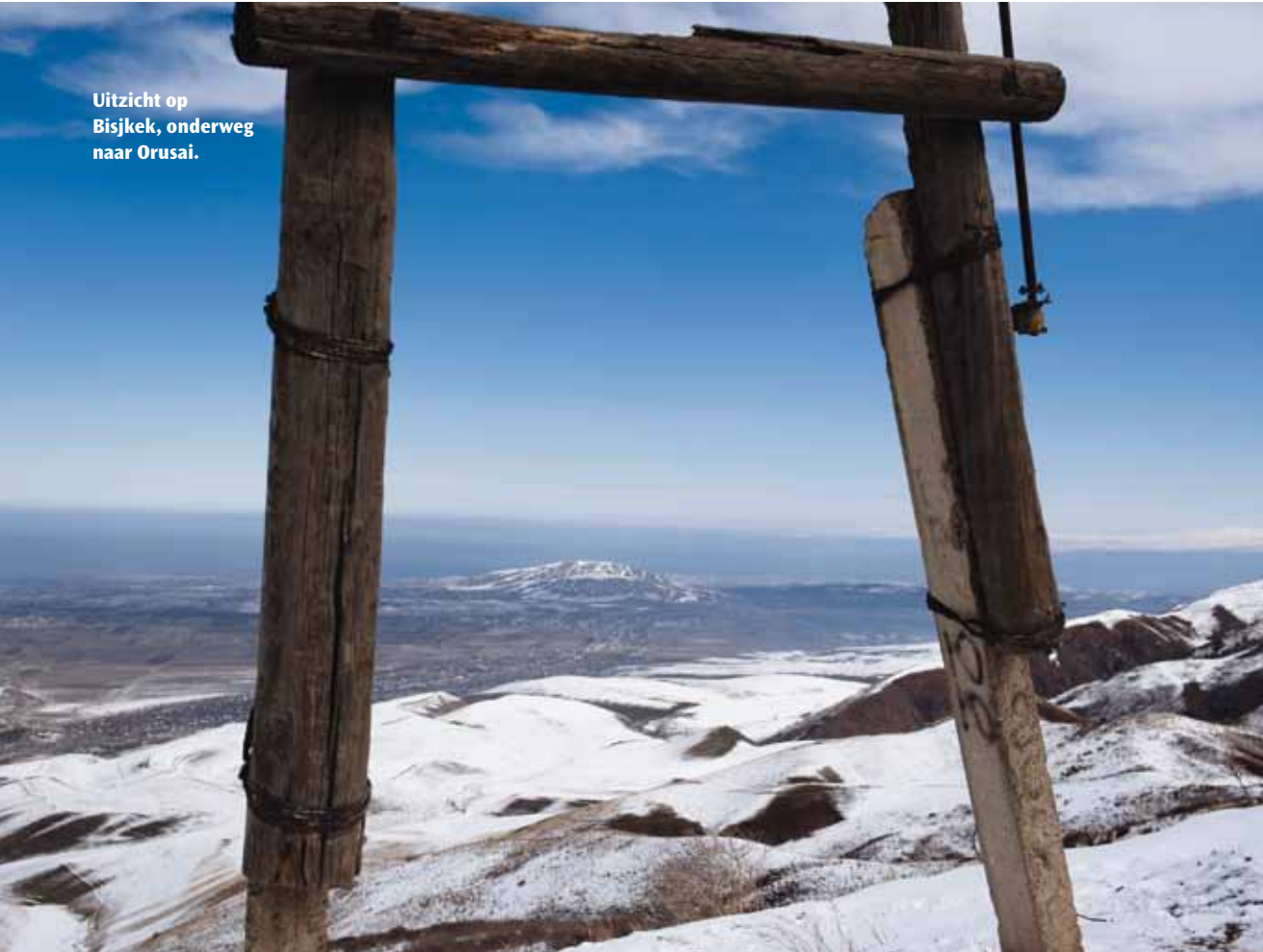
Uitzicht op Bisjkek, onderweg naar Orusai.