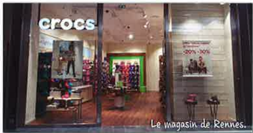
Le magasin de Rennes.

● Parcours similaire pour une autre marque américaine, Crocs, qui, quelques mois après Paris, a inauguré un nouveau magasin à Rennes le 23 octobre dans le centre commercial Rennes Alma. Cette toute nouvelle boutique est son 13 e point de vente français. Le 30 novembre ouvrira un 14 e point de vente implanté à Dijon dans le centre La Toison-d'Or.