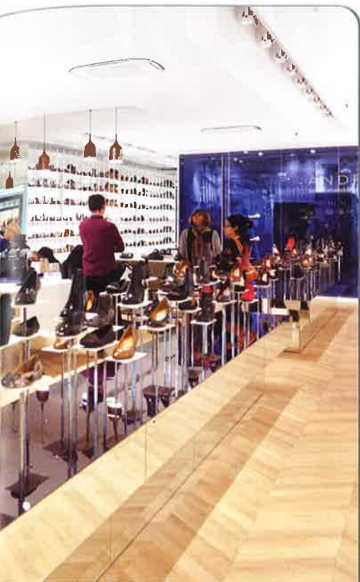
Le nouveau concept André s'apparente à un grand dressing.