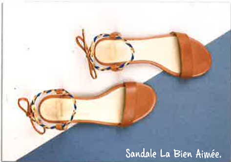
Sandale La Bien Aimée.

Les partenariats entre marques s'enchaînent. Voici venu le tour de Bobbies qui s'associe à la marque de prêt-à-porter féminin Marie Sixtine . Résultat de leur travail en commun : une jolie sandale avec sa bride en cuir tressé.