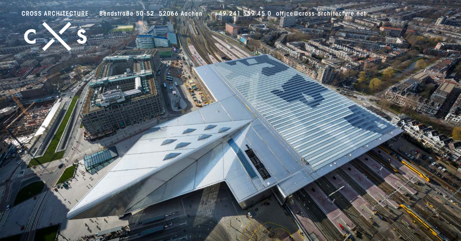
EXPRESSIVE Dachform mit 130.000 PV-Zellen

Falls Sie weitere Informationen benötigen, freuen wir uns auf Ihre Anfrage unter +49 241 559 45 0 oder per Email unter office@cross-architecture.net . Herr Sporer steht Ihnen als Ansprechpartner zur Verfügung.