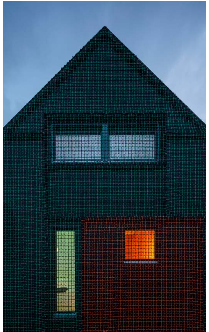
NETZE als Fassadenmaterial