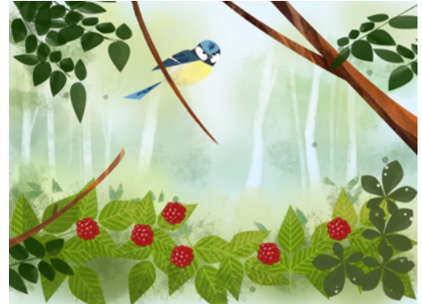
ราสเบอร์รี่

สำหรับข้อมูลเพิ่มเติม ท่านสามารถดาวน์โหลด press kit และ screenshot ได้ที่ http://megalearn.se/press