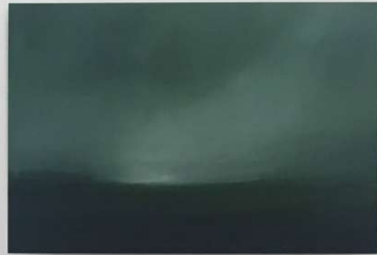
LANDSCAPE 2, 2018