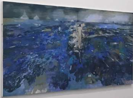
TANJA SELZER (GRÜN)