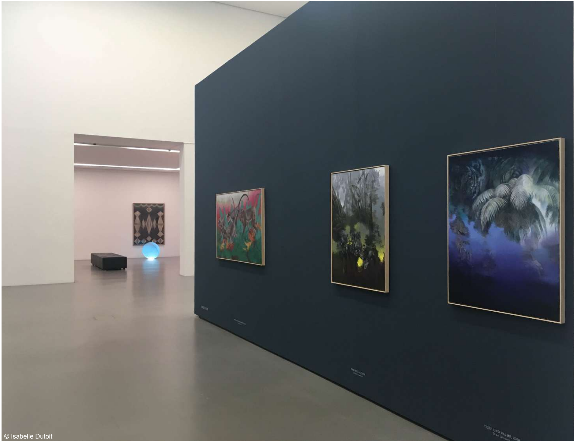
TIGER UND PALME, 2010 Öl auf Leinwand