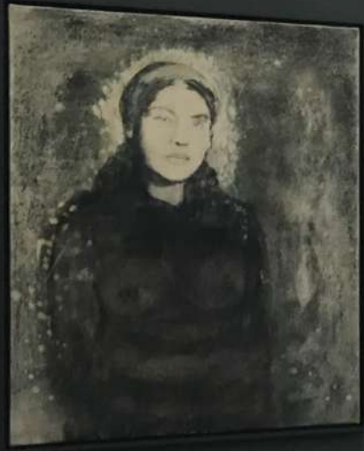
MUTERIN II, 2019 Öl auf Leinwand