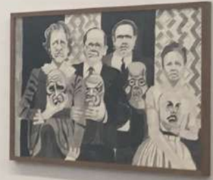
WENN DIE TRÄUMER SICH BEWEGEN SIND SIE SCHON DA