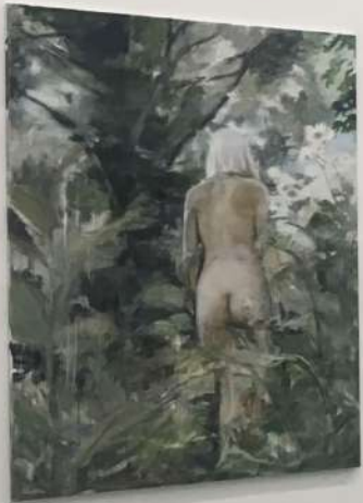
MIRIAM VLAMING (BLAU)