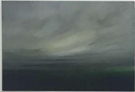
LANDSCAPE 1, 2018