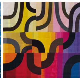
© Michèle G. Samter (CH) Sophisticated Lady