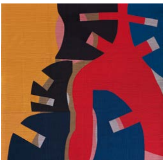
© Gerri Spilka (USA) Interactions #10