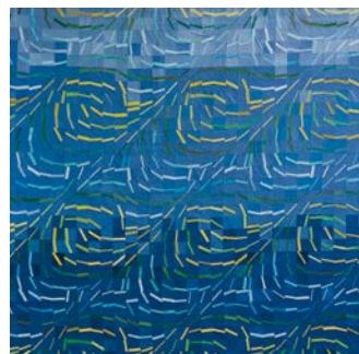
© Elke Klein (D) Tiles #4: Waves