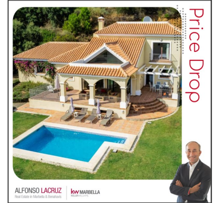
Montemayor, Benahavis 4 Dorm., 3 Baños, 397 m 2 y vistas al mar Rebajado a 890.000€

** Dado que cada caso es diferente y este artículo no profundiza realmente sobre el tema, recomendamos consultar el contenido del mismo con su abogado de confianza.