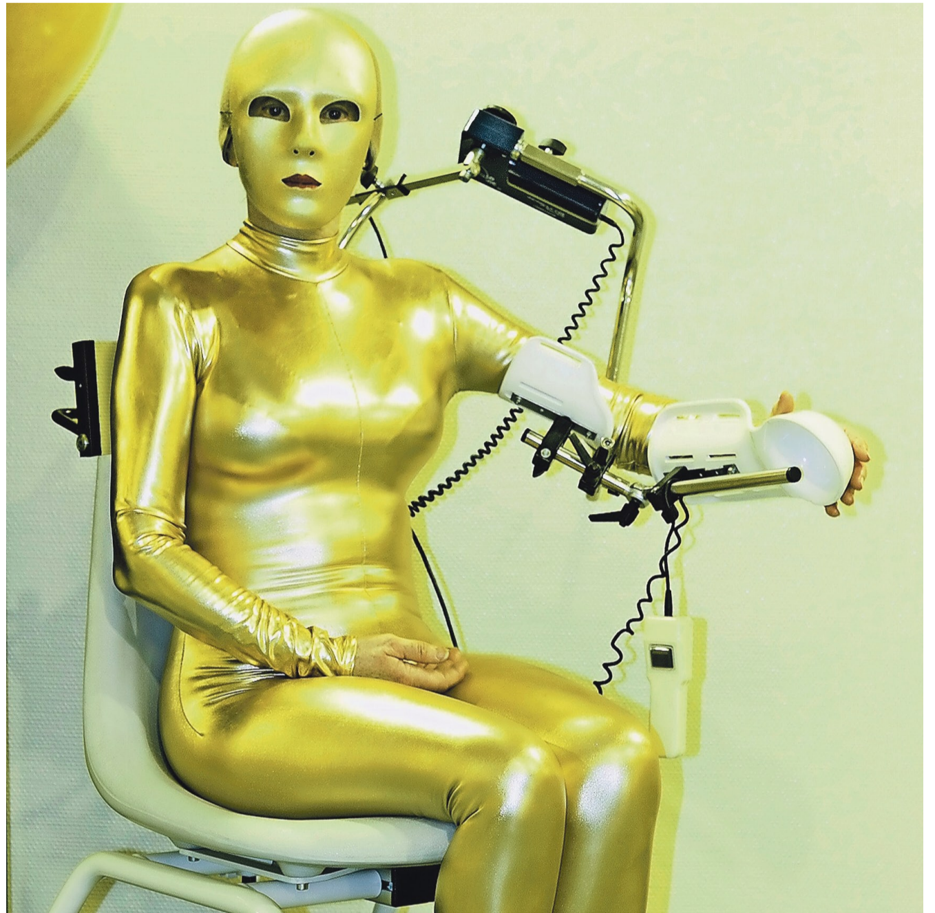
Mensch-Maschine: Foto aus der Serie «Hotel Dolores (2008-2012)».