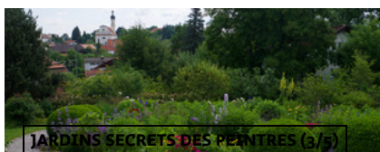
JARDINS SECRETS DES PEINTRES (3/5) Vassily Kandinsky et Gabriele Münter, le jardin de