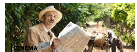
CINÉMA L'indicible mélancolie de l'exilé