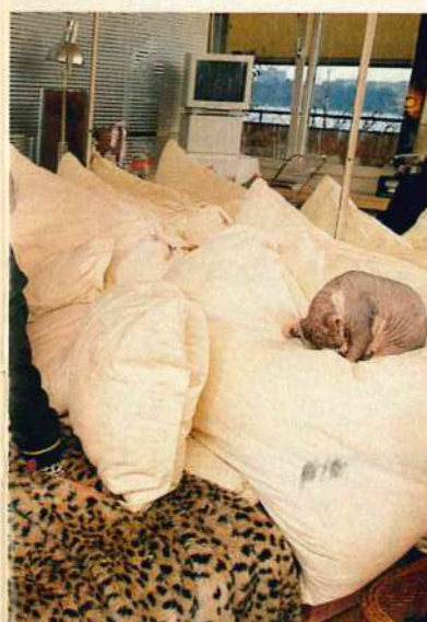
«Sphinxen lieben Menschenwärme.»