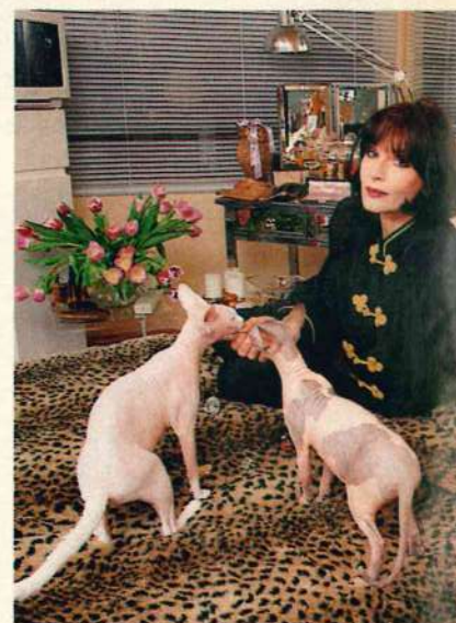
Schmusen in Manons Schlafzimmer:

Die Sphinxkatze gehört zu den exklusivsten Katzenrassen und ist sehr selten. Ihr graziler Körper ist faltig und glättet sich im Alter. Sie ist sensibel und verspielt und liebt es, wenn man sie knuddelt.