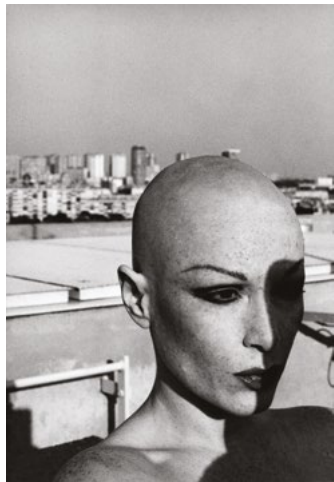
Credits: Manon, Aus der Serie: 'La dame au crâne rasé', 1977/78, Silver gelatin print, 65x50cm