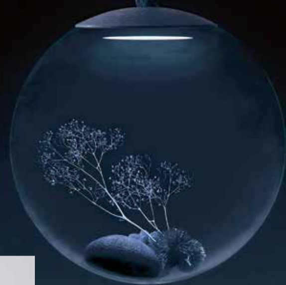
Observatoire naturel On compose sa nature morte à l'envi en dévissant le globe en verre de la suspension "Aizome" en bois et corde.