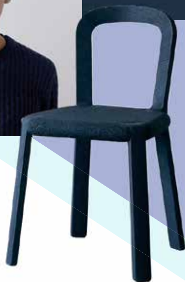
Blue mood. L'assise en liège et la structure en bois de la chaise "Aizome" affichent un bleu encre profond.