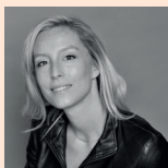
Adélaïde de Clermont-Tonnerre