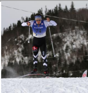
Alexis Turgeon Athlète élite en ski de fond