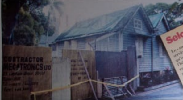
Le toit du « mess » de l'hôpital de Flacq a été recouvert de bâches.