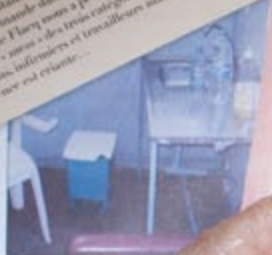
Sans robinet adéquat, les infirmiers doivent utiliser des bouteilles d'électrocution soignée.