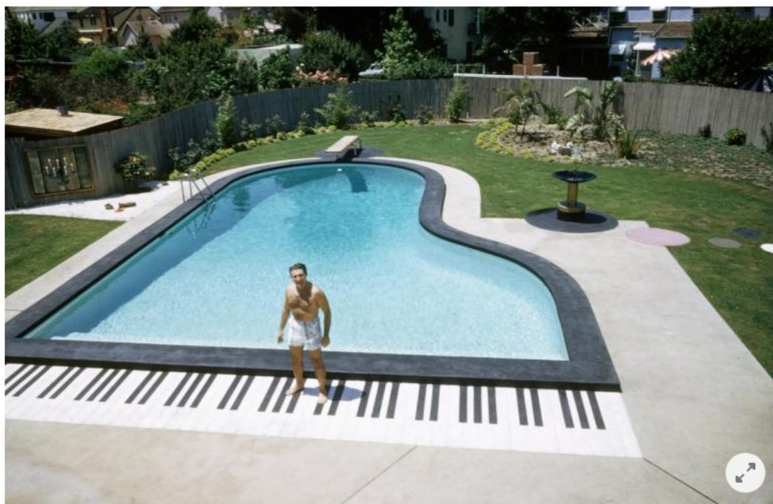
Der Piano-Pool in Los Angeles hat das Potential zum Lieblingspool; zumindest für Musikliebhaber und Freunde von schrägen Ideen. Auf dem Bild der Pianist und spätere Entertainer Liberace, 1954