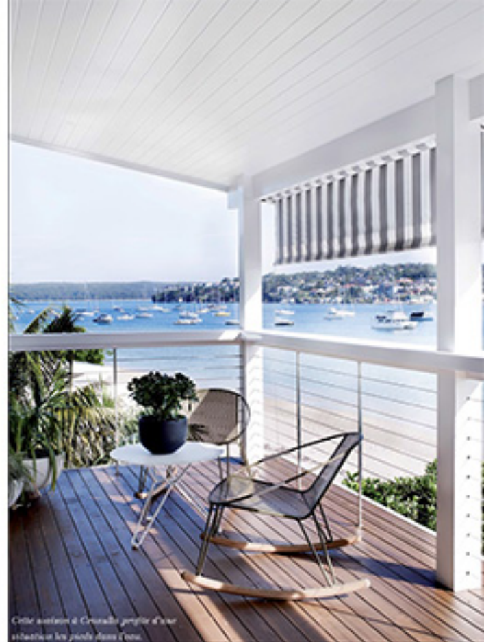
Cette maison à Cronulla profite d'une situation les jardins dans l'eau.

Au sud de Sydney en Australie, l'agence Amber Road a entièrement repensé les intérieurs de cette résidence à Cronulla en les magnifiant aussi naturellement que possible, de manière presque minimaliste. Revue de détails.