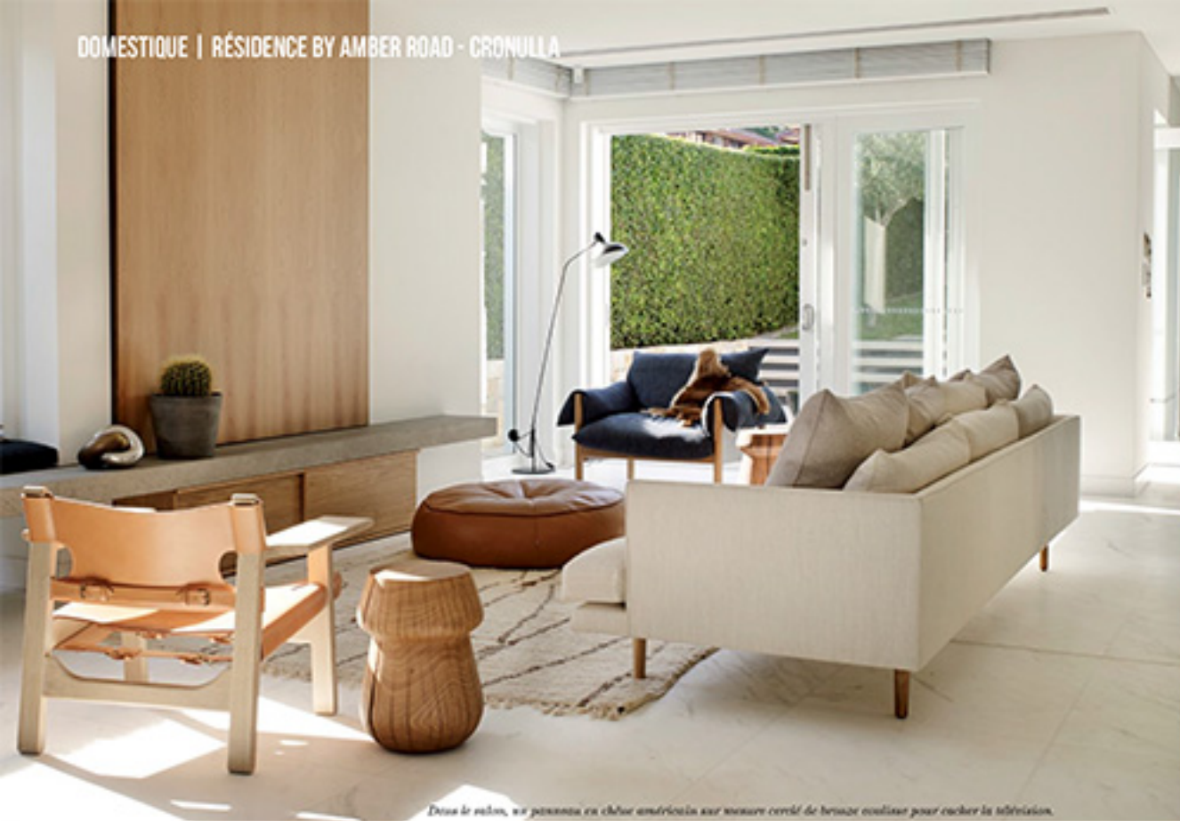
Dans le salon, un pouf en cuir américain sur mesure perché de bronze est là pour cacher la télévision.