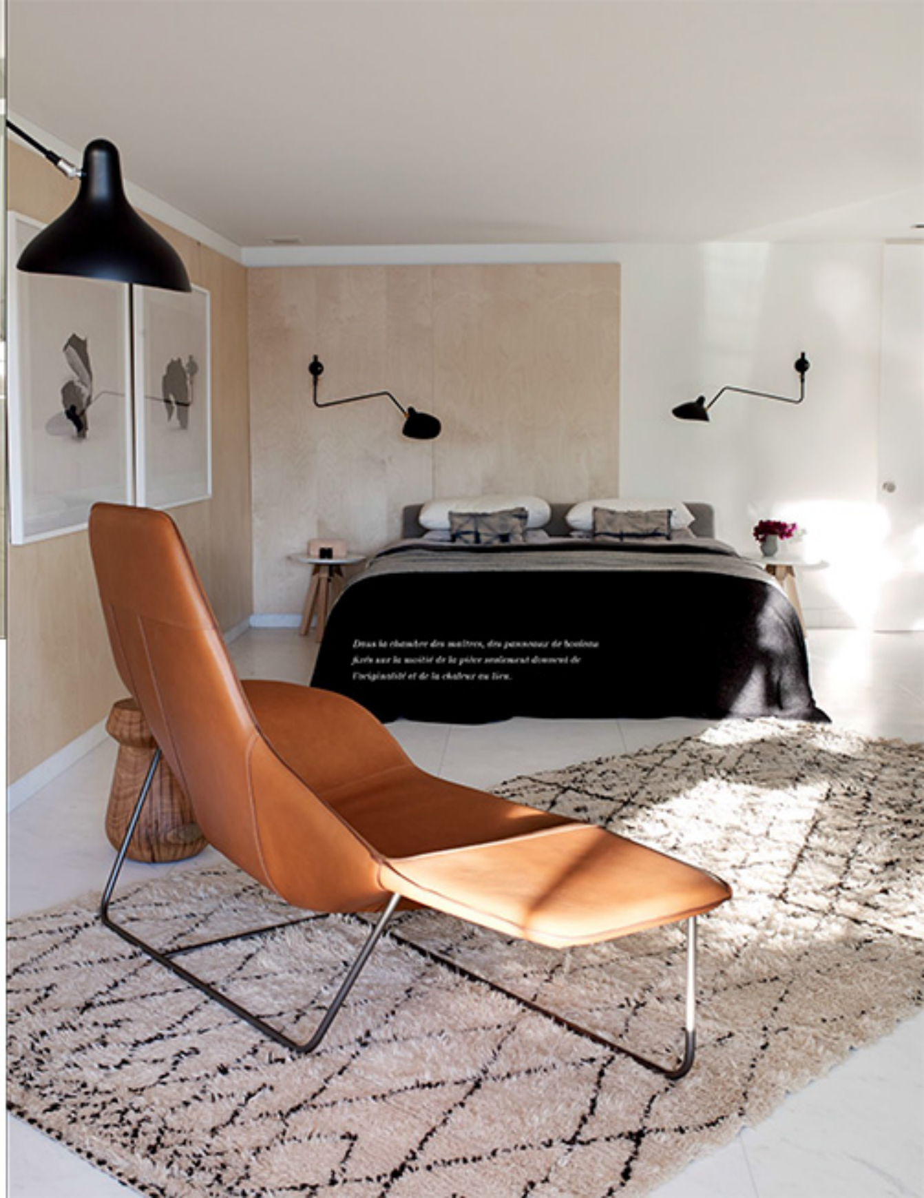
Dans la chambre des maîtres, des poufs en cuir américain sur mesure sont là pour offrir le confort et de la chaleur au lit.