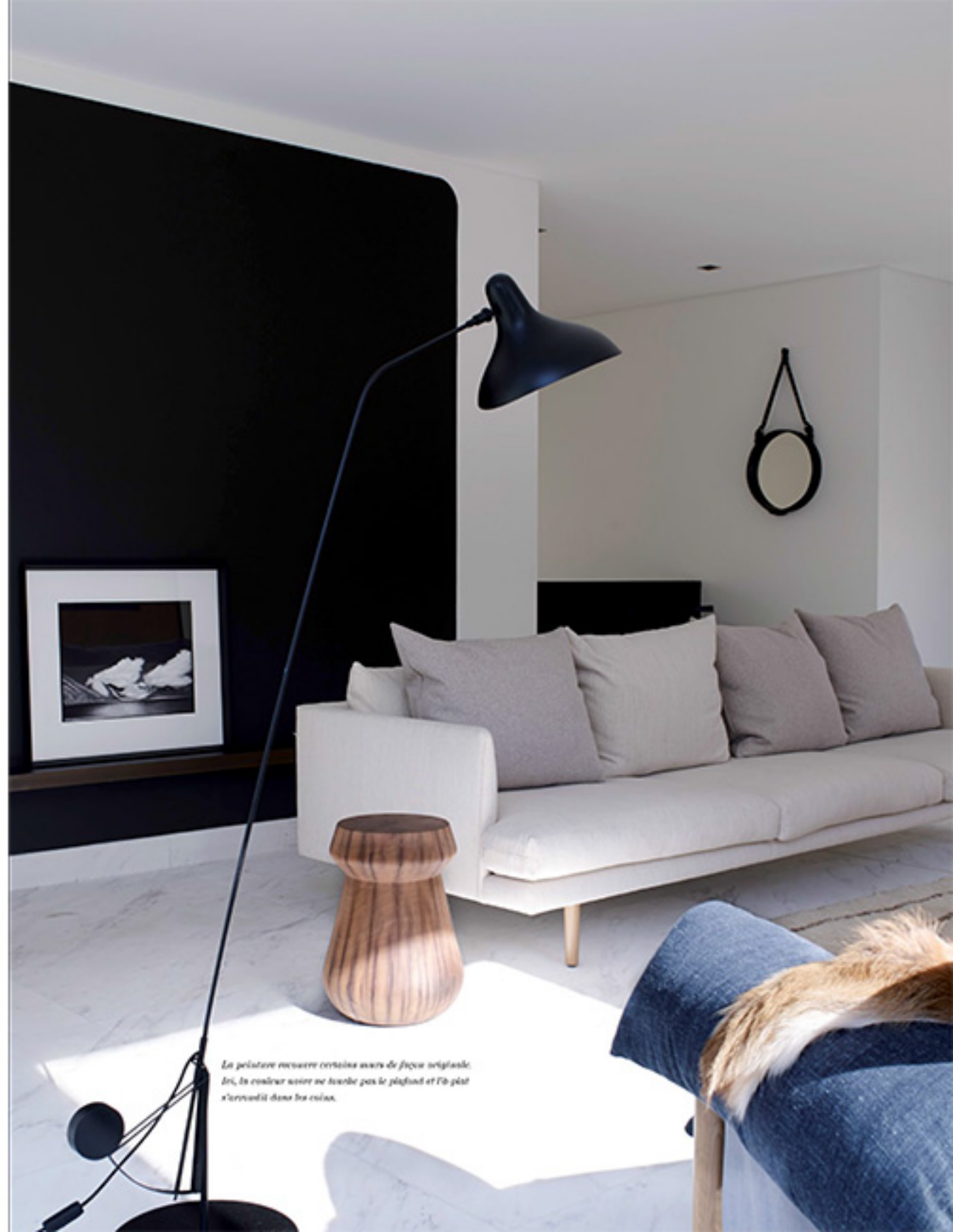
La peinture recouvre certains murs de façon sculpturale. Ici, la couleur noire ne touche pas le plafond et l'a plutôt servi d'élément dans les coins.

Un autre challenge consistait aussi à unir les deux zones de vie existantes qui étaient trop distinctes et froides. Pour se faire, elle a imaginé un long banc suspendu en béton de 10 mètres courant le long des murs pour lier les espaces et ainsi « générer une communication plus alléante pour la famille ». Juste au-dessus, dans le salon, un panneau en chêne américain sur mesure, cerclé de bronze et coiffé d'un tissu, a été installé afin de pouvoir dissimuler ou révéler le téléviseur. Dans l'entrée, sous une sculpture métallique suspendue d'un nu couché, un autre banc d'une taille plus modeste – toujours en chêne américain et cerclé de bronze – anime également le lieu. Les chambres des enfants ont elles aussi subi quelques métamorphoses pour faciliter le rangement.