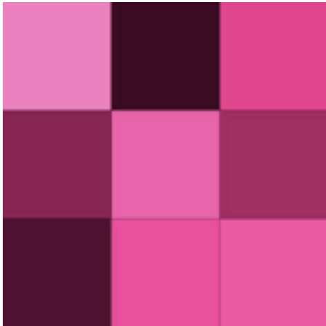
Gama de rosados