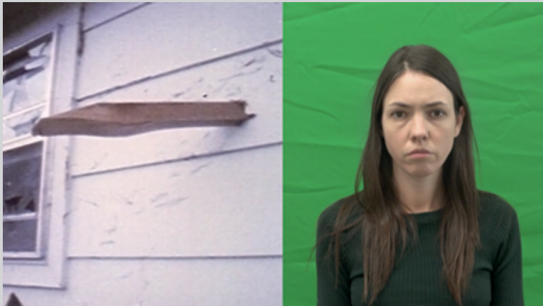
Les quatre récits d'Alice, 2019, vidéo, 1 min

L'exposition T'envoler peut être vue comme une installation à grande échelle 1 , tant les liens entre les nombreuses œuvres – plus d'une quinzaine – sont solides, et tant l'effet immersif de l'ensemble est fort. Elle est d'une ampleur et d'une complexité qui rendent impossible, ici, un compte rendu exhaustif. Nous nous concentrerons donc sur ce qui, selon moi, est le trait distinctif de l'approche de Myriam Jacob-Allard : sa sensibilité aux tonalités, qu'elles soient liées aux mots, à la musique ou aux images.