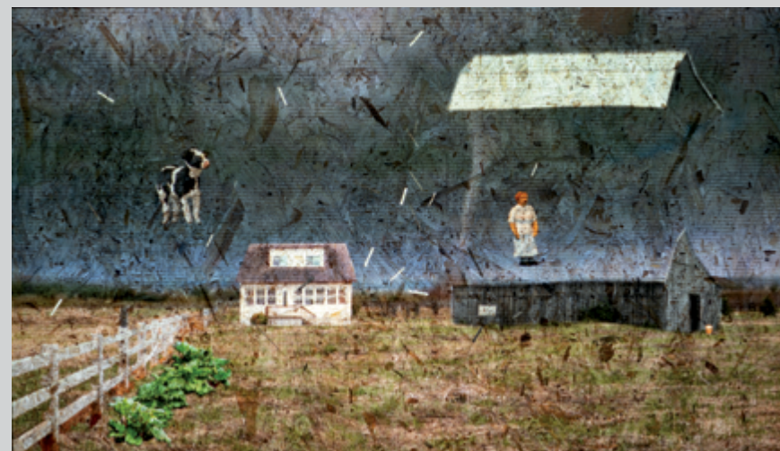
Se faire emporter par le vent, 2019, projection vidéo sur panneau de copeaux de bois, 3 min, photo : Guy L'Heureux

Ce que l'artiste pointe à travers ces variations et ces décalages (avec humour, mais non de façon ironique), c'est le travail de remodelage fictionnel qui fonde non seulement notre rapport au monde 2 , mais aussi notre capacité à créer un réel partagé. L'épisode d'envol, sinon traumatique, du moins exceptionnel, Alice le rejoue fictionnellement pour elle-même et pour ses proches. C'est aussi ce que fait sa petite fille en créant des objets qui reprennent, sur différents registres et à travers différentes techniques, des aspects du récit ; dans la galerie, on retrouve entre autres, disséminés aux quatre vents, des tornades en papier mâché (dont une géante), des vidéos d'animation et des cailloux sur lesquels est peinte la maison de la grand-mère.