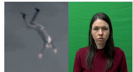
© Myriam Jacob-Allard, Les quatre récits d'Alice (2019)

Son travail a été présenté dans de nombreuses expositions individuelles et collectives ainsi que dans des festivals, au Canada, en Europe et en Amérique du Sud. Mentionnons quelques présentations récentes : Il était une fois... le Western. Une mythologie entre art et cinéma