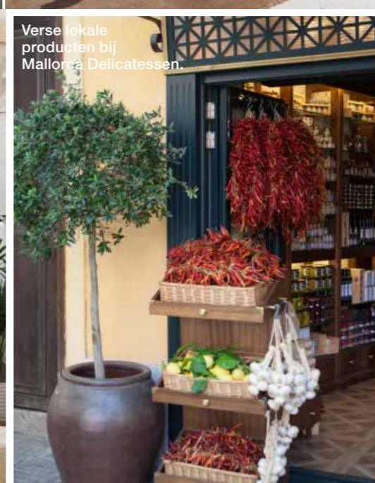
Verse lokale producten bij Mallorca Delicatessen.