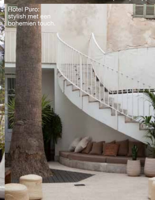
Hotel Puro: stylish met een bohemien touch.