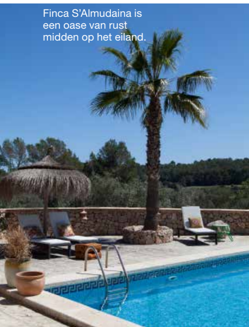
Finca S'Almudaina is een oase van rust midden op het eiland.