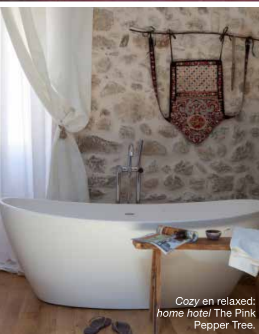
Cozy en relaxed: home hotel The Pink Pepper Tree.