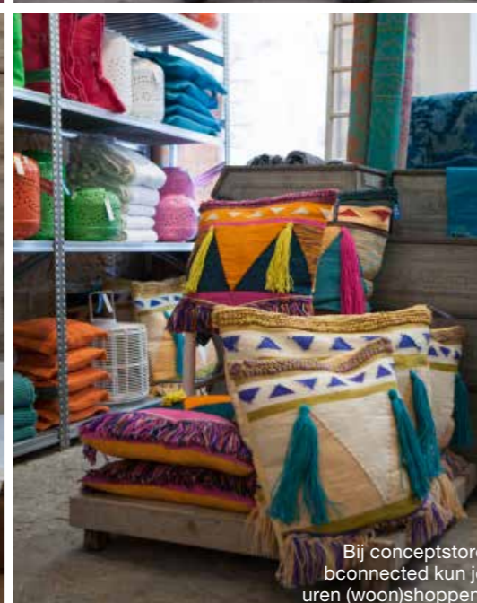
Bij conceptstore bconnected kun je uren (woon)shoppen.