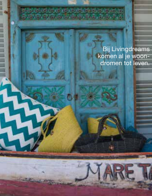
Bij Livingdreams komen al je woon-dromen tot leven.