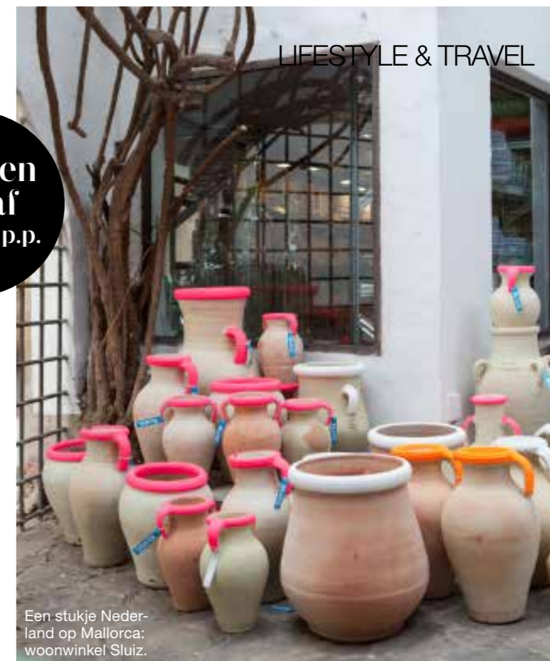
Een stukje Nederland op Mallorca: woonwinkel Sluiz.

Op deze reis zijn de ANVR- en SGR voorwaarden van toepassing.