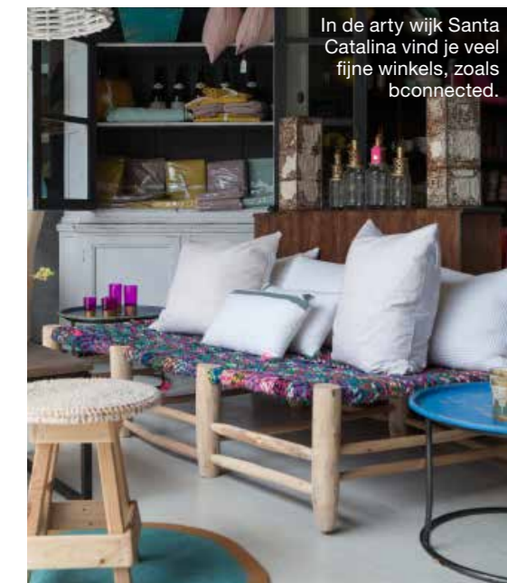
In de arty wijk Santa Catalina vind je veel fijne winkels, zoals bconnected.