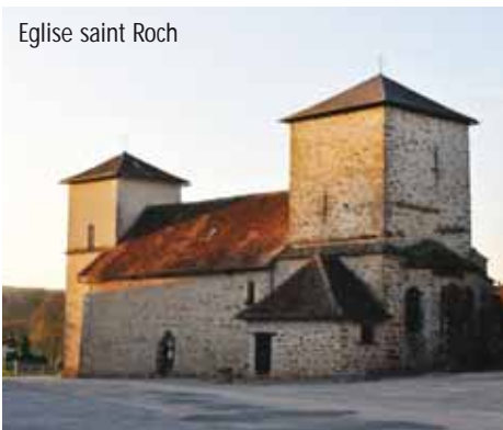
Eglise saint Roch

Reprendre le descriptif du sentier "Le Père Castor" (voir au dos) aux points 4, 5 et 6. Rejoindre ainsi le point de départ au lac de la Roche.