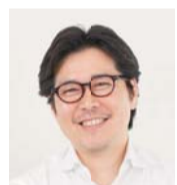
一般財団法人 田中財団 田中 田中

群馬イノベーションスクールとは、群馬の地から次代を担う起業家を発掘、奨励し、「起業」や「イノベーション」を通じて地域を元気にしてゆくビジネススクールです。時代をブレクスルーするような新しい技術、サービスのイノベーションに挑戦する起業家や事業継承者を数多く輩出できる、21世紀の寺子屋を目指します。群馬はいままでも優れた起業家を多く輩出している土地柄であり、今後も引き続き若きイノベーターにとってチャンスにあふれた地であり続けるために、このプロジェクトを推進してまいります。