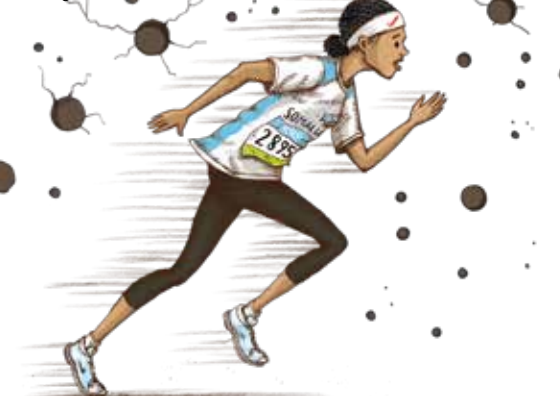
Illustration: Nontira Kigle

Fr 02.03. Fr 27.04. Do 01.03. Di 13.03. Do 03.05. Fr 09.03. So 29.04. „Einblicke“ Lehrersichtver- anstaltung Do 15.03. Do 26.04. Sa 10.03.