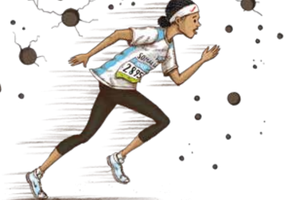
Illustration: Nontira Kigle

Fr 02.03. Fr 27.04. Do 01.03. Di 13.03. Do 03.05. Fr 09.03. So 29.04. „Einblicke“ Di 15.03. Do 15.03. Sa 10.03. Do 01.03. Do 19.04. Do 26.04.