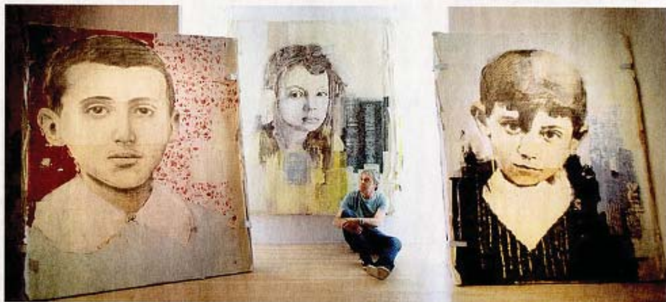
Louis Boudreault pose près des portraits qu'il a réalisés à partir de photographies de Marcel Proust, Marguerite Duras et Pablo Picasso lorsqu'ils étaient enfants.