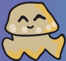
Mastigias papua atau "Ubur-ubur emas". Jenis ubur-ubur adalah yang paling melimpah jumlahnya