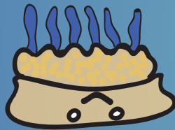
Cassiopeia sp. atau "Ubur-ubur terbalik"