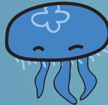
Aurelia aurita atau "Ubur-ubur bulan"