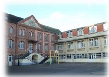
ECOLE Jeanne d'Arc COLLEGE St Bertulphe