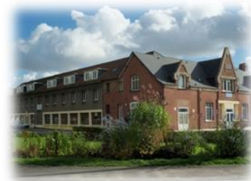
LYCEE PROFESSIONNEL Ste Marie