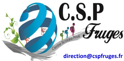
SECTION SPORTIVE VTT (COLLEGE)