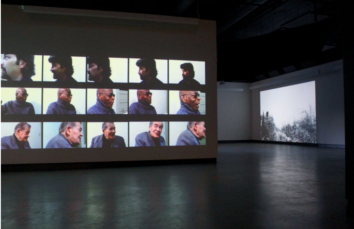
«Peripheral Island» (2016) de Roberto Santaguida et «Tierra Quemada» (2015) de Gabriela Golder (à l'arrière-plan)

17 septembre 2016 | Jérôme Delgado - Collaborateur | Arts visuels