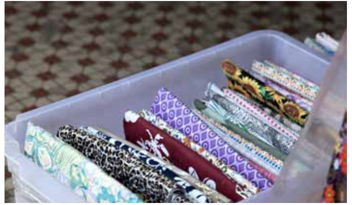
已損壞的紡織品是未完成或已損壞的紡織產品，例如有顏色或列印缺陷的紡織品。