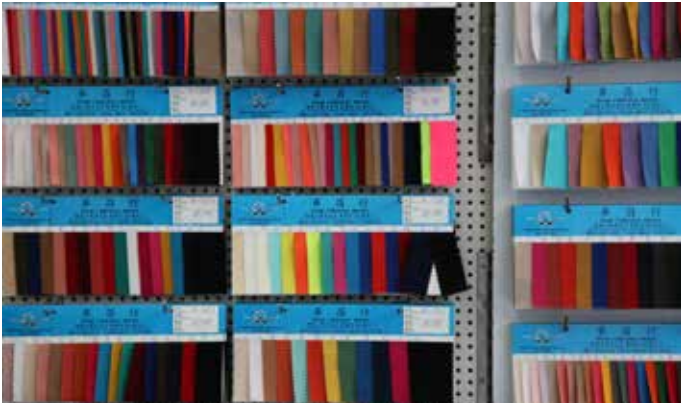
紡織色板是剩餘的紡織色板樣品。