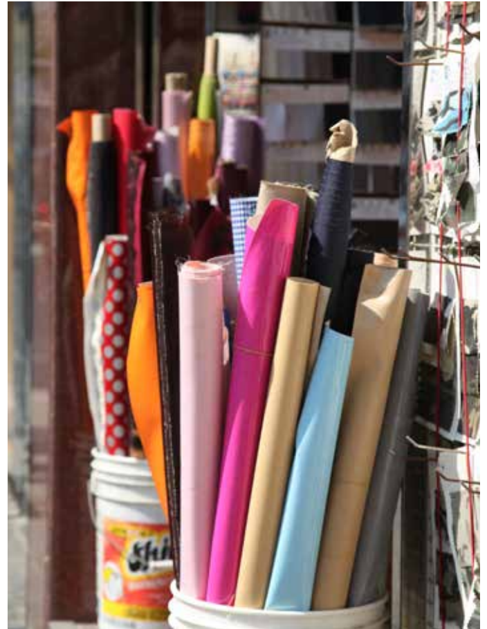
卷軸尾端布料是成衣製造工廠的盈餘紡織品。