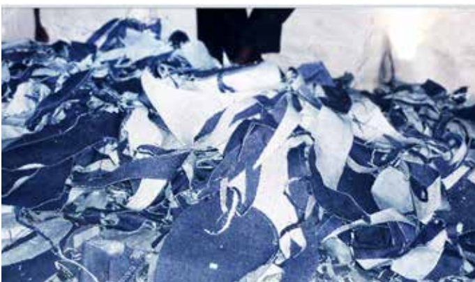
布料碎屑是指切割和縫製成衣過程中所剩餘的紡織品。