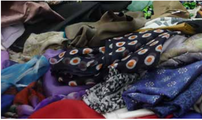
樣品廢料是工廠製造樣品所剩下的紡織品。