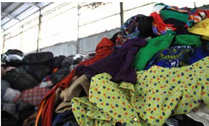
二手服裝 is 消費者使用過或丟棄的服裝，包括衣物或飾品。