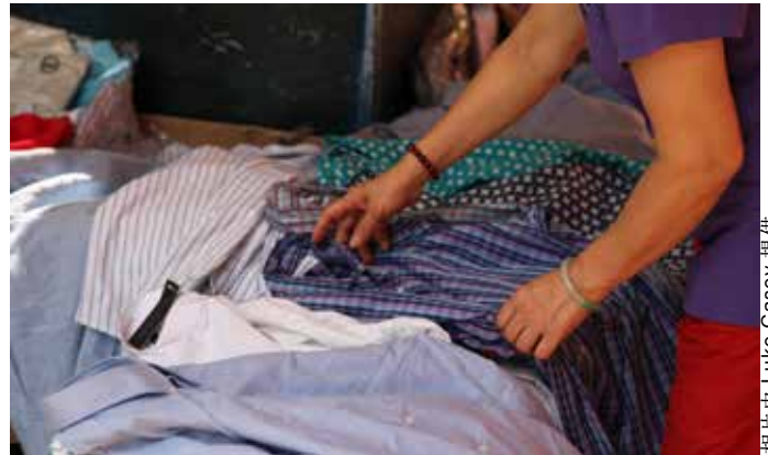
廢棄成衣是尚未被使用過的成衣。