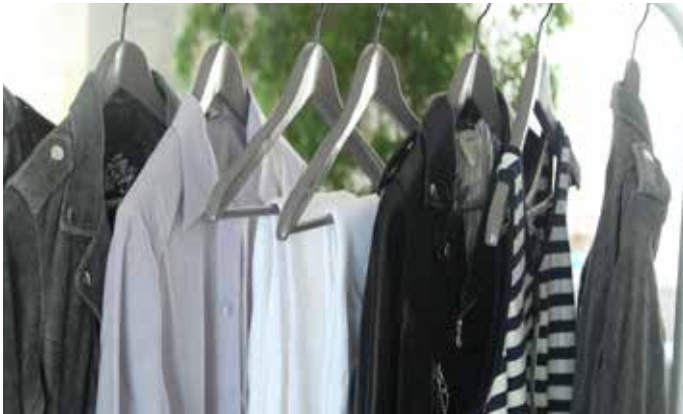
服裝樣品是服裝設計和生產過程中的樣品。