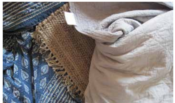
二手織品是指任何消費者使用過或丟棄的紡織品，不包括衣物或飾品。