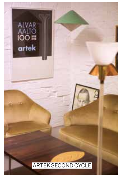
ARTEK SECOND CYCLE