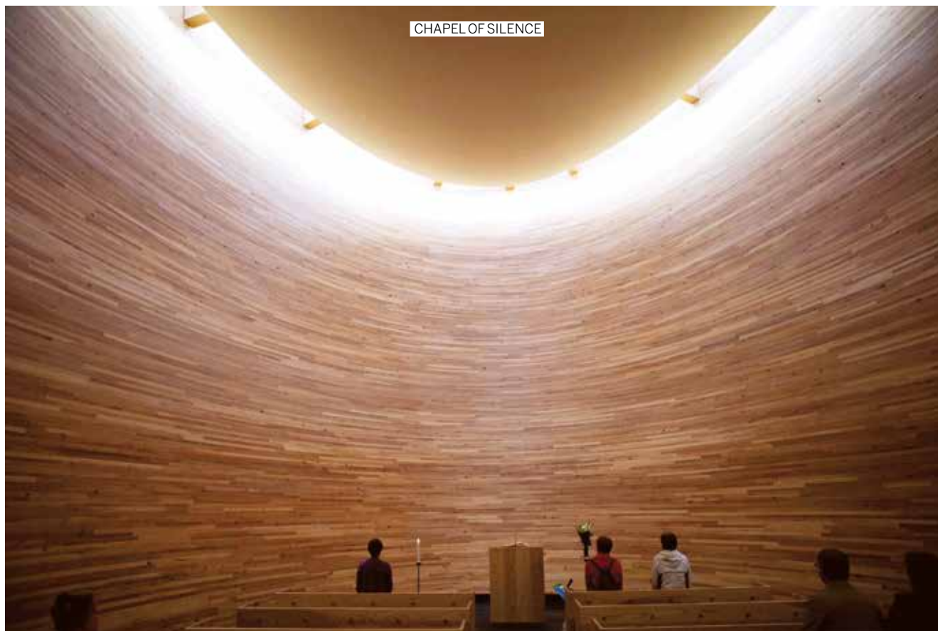
CHAPEL OF SILENCE

sfeertje op. Putte is dan weer iets helemaal anders, ook al heeft het dezelfde chef. Hier eet je een heerlijke pizza aan oude schooltafels, met hippe muziek en nog hipper personeel. Fabrik opende nog maar enkele weken geleden en trekt resoluut de kaart van verfijnde simplicitéit. Het interieur werd volledig op maat gemaakt. De wijnkast bestaat uit gerecupereerde ramen en de stoelen werden speciaal voor deze plek gemaakt.