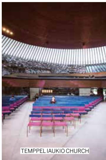
TEMPEL IAUKIO CHURCH